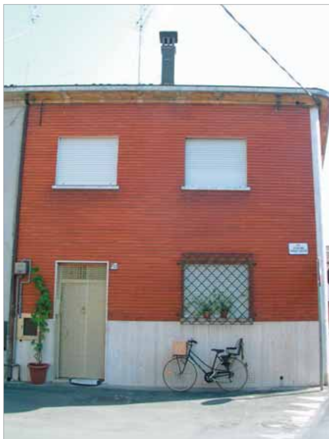
Via Garzoni 47 Fronte Principale